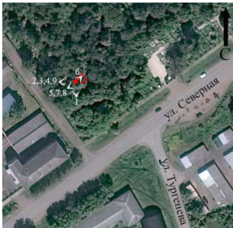
Схема фотофиксации предмета охраны