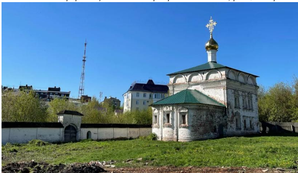
Илл 19. Объект культурного наследия федерального значения «Трехсвятительская церковь», дата фото 2021 г.