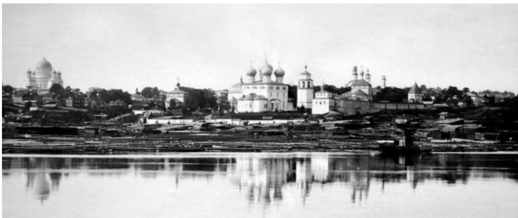
Илл.20. Вятка. Панорама Успенского Трифонова монастыря. Дата фото нач. XX в.