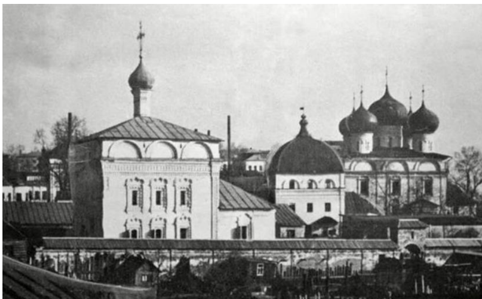
Илл. 18. Вятка. Успенский Трифонов мужской монастырь. Трехсвятительская церковь, дата фото нач. XX в.