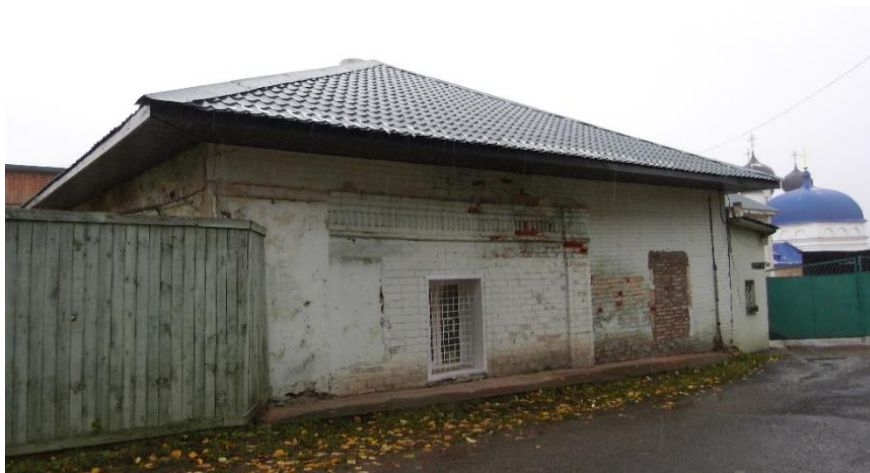
Илл. 24. Выявленный объект культурного наследия «Монастырская караульня», 1740-е гг., дата фото: 14 октября 2014 г.