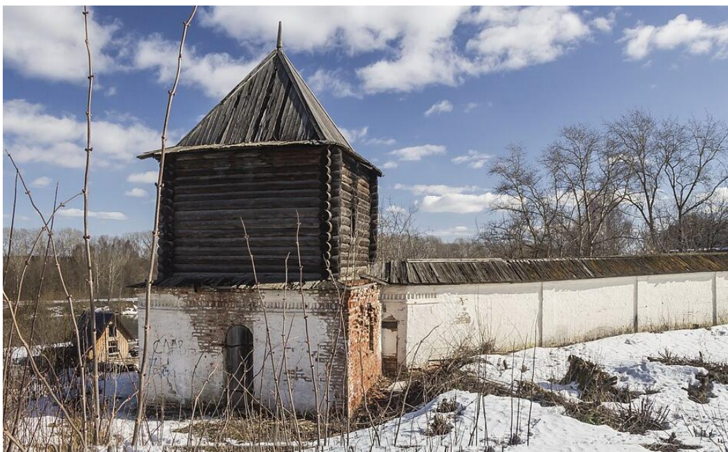
Илл 22. Выявленный объект культурного наследия «Юго – восточная башня и ограда», дата фото: 23 марта 2020 г.